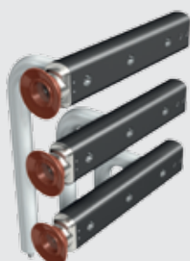
Специальная форма сборных шин