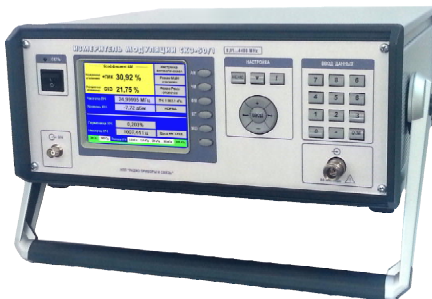
Рисунок 1 - Общий вид приборов

Внешний вид приборов аналогичен и приведен на рисунке 1.