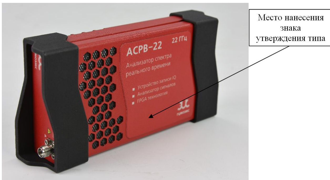
Рисунок 3 – Общий вид, место нанесения знака утверждения типа анализаторов спектра реального времени АСПВ модификаций АСПВ-20, АСПВ-22, АСПВ-40 с типом интерфейса управления и передачи данных USB