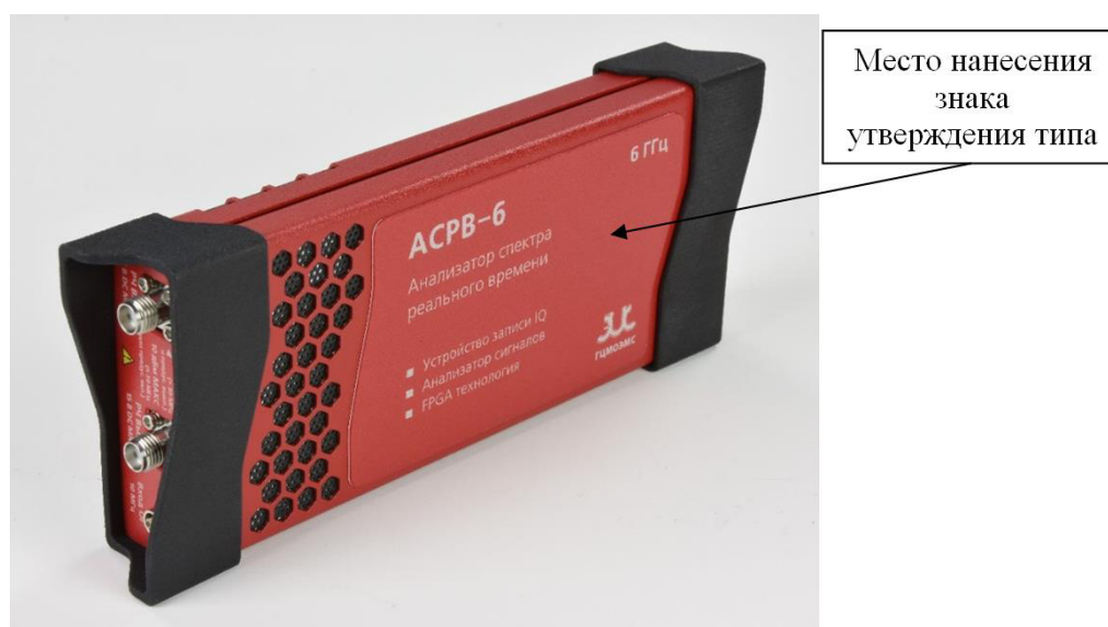
Рисунок 1 – Общий вид, место нанесения знака утверждения типа анализаторов спектра реального времени АСРВ модификаций АСРВ-4, АСРВ-6, АСРВ-8 с типом интерфейса управления и передачи данных USB

Общий вид анализаторов спектра реального времени АСРВ, место для нанесения знака утверждения типа представлены на рисунках 1 – 4. Место для нанесения серийного номера, идентифицирующего каждый экземпляр СИ, представлено на рисунке 5.