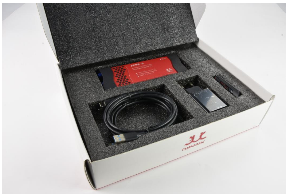
Рисунок 6 – Комплектность средства измерений (анализатор спектра реального времени АСРВ, кабель питания, кабель управления и передачи данных, блок питания, флеш-накопитель)