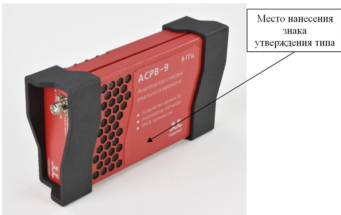
Рисунок 2 – Общий вид, место нанесения знака утверждения типа анализаторов спектра реального времени АСПВ модификация АСПВ-9 с типом интерфейса управления и передачи данных USB