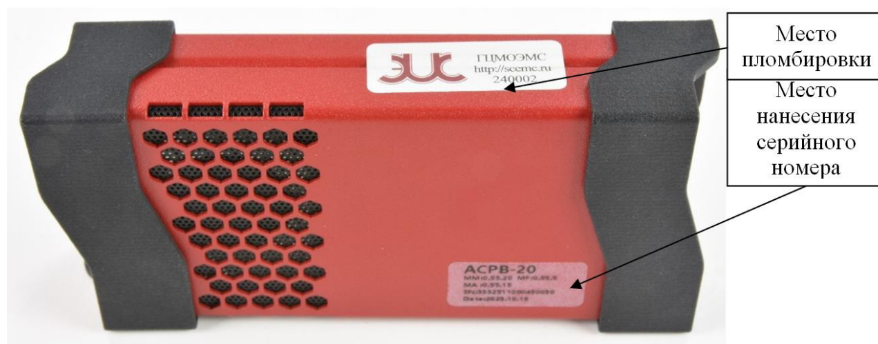
Рисунок 5 – Схема пломбировки от несанкционированного доступа и место нанесения серийного номера, идентифицирующего каждый экземпляр средства измерений